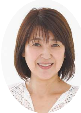
新田 恵利 氏