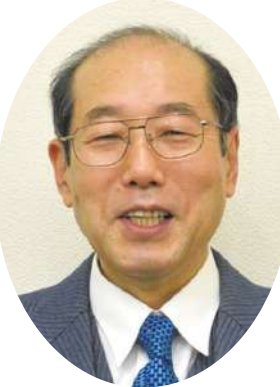
桐谷 広人 氏

将棋棋士・投資家 1949年生まれ。広島県竹原市出身。 1984年、証券協会とのつきあいで株式投資を始める。2007年、七段で現役棋士を引退(57歳)。株式投資に力を入れるが、2008年、リーマンショックで大損。3億の金融資産が6分の1に。以後、現金をほとんど使わず、株主優待生活を始める。生活のほとんどを企業の株主優待で賄い、暮らしている。独特なライフスタイルがテレビでも人気で、お茶の間の投資家として絶大な人気を誇る。